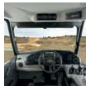
In der Kabine findet der Fahrer einen sicheren, komfortablen und ergonomischen Arbeitsplatz vor.