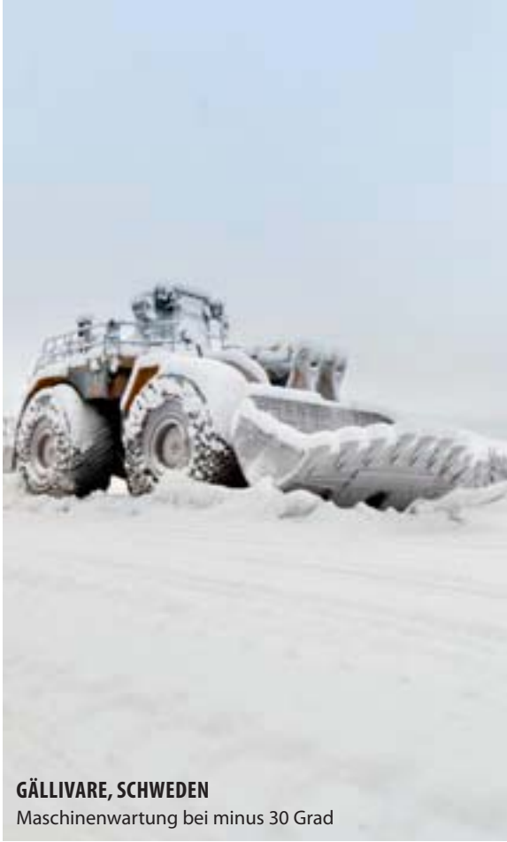
GÄLLIVARE, SCHWEDEN Maschinenwartung bei minus 30 Grad