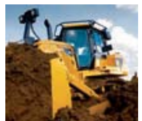
Start ins nächste Jahrhundert – der neue Cat D7E im Einsatz.

Die Kunden wurden auch zur Kabine befragt. „Sie hat sich vielleicht etwas zu fundamental verändert“,