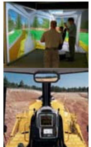
Von der Computersimulation zur endgültigen Kabinenversion.