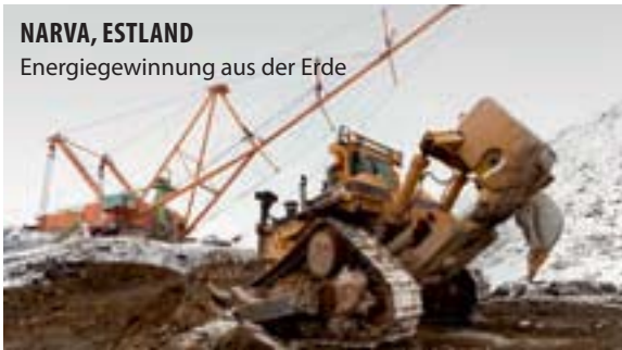
NARVA, ESTLAND Energiegewinnung aus der Erde