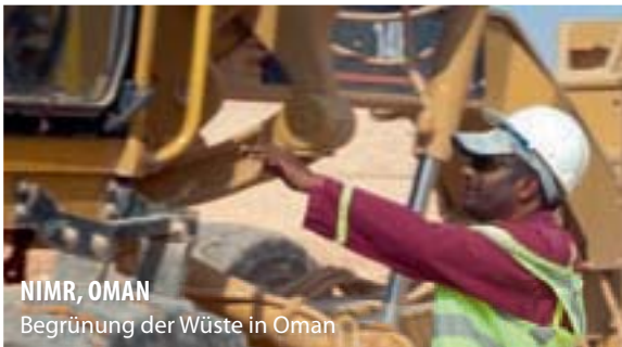
NIMIR, OMAN Begrünung der Wüste in Oman