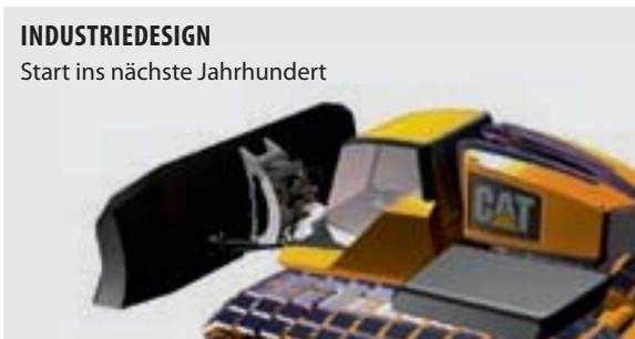
INDUSTRIEDESIGN Start ins nächste Jahrhundert