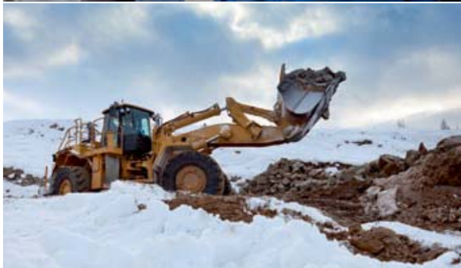
Cat Radlader 988H (oben) und Motorgrader 16H spielen eine maßgebliche Rolle bei Bau und Unterhaltung der 150 km langen Fahrstrecken.